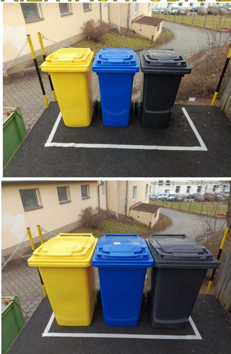
Pro Vaši představu je zde zobrazeno, jaký prostor zaberou nádoby o objemu 240 l oproti nádobám o objemu 120 l. Bílé pole pro umístění je v obou případech stejné